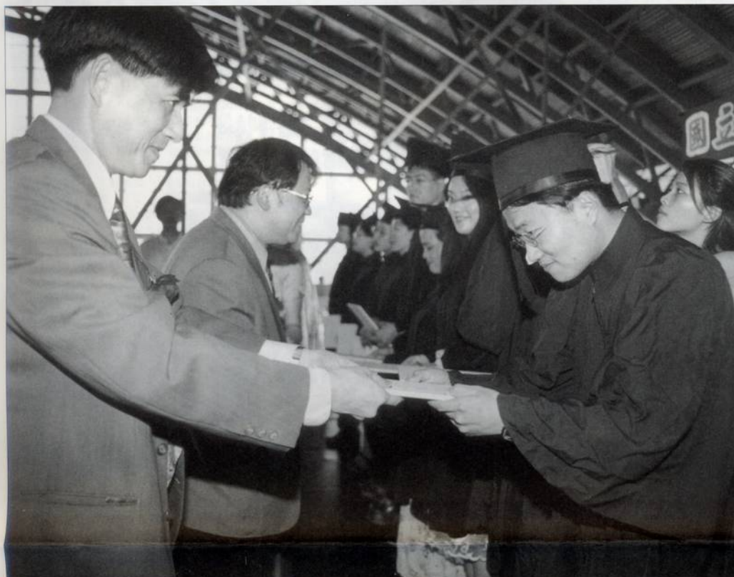
國立藝術學院 87 學年度水上畢業典禮

出版/國立藝術學院 地址/台北市112北投區學園路1號 發行人/邱坤良 出版組/2893-8712 傳真/2894-5124 E-Mail/newsletter@www.nia.edu.tw 中華民國88年7月1日 第14期 <第1版>