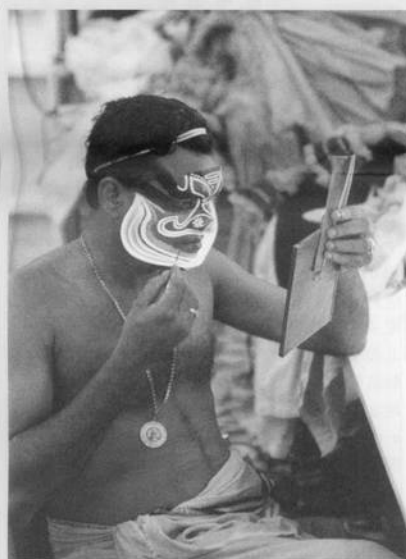
印度卡達卡里舞劇演員演出前專心勾勒臉譜

我想對他們的懷念不只是精彩的喉音唱法與這幾天的勞累，而是讓我深刻的體驗到不同國度的人，有不同的思想與生活習慣，也許我不習慣他們正如他們不習慣我一樣，雖然這幾天的相處有起伏，但是在海關前的那一刻完全化為歡笑與感謝，我感謝他們給我這次難以忘懷的經驗。