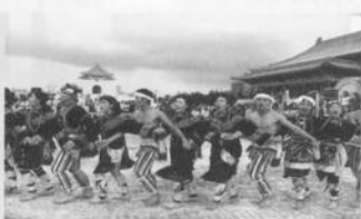
執行編輯/張光慧、林俊古、顧心怡、楊再熙、吳美玲、林玲君