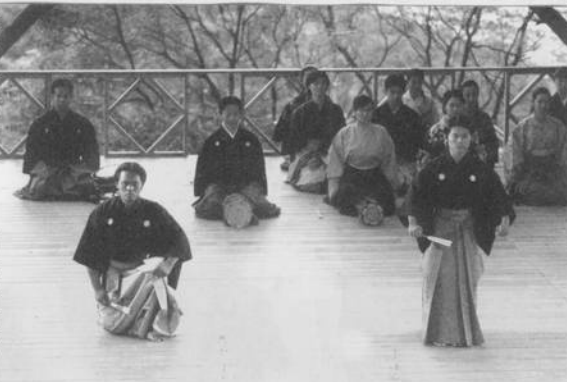
藝術學院學生演出能劇《狸狸》

而這些竟然光憑著學員們自己的悟性、對著日本老師極具象徵性的口傳心授的傳統教學方式的體悟和藉由偉大的羅馬拼音所帶來的對歌詞的記憶和日文中夾雜的漢字所帶來的理解上的幫助（老實說幫助不大），配合著小鼓的節拍和能笛的旋律的引導（這些倒是較能突破語言的藩籬）及兩個通日語的老師適時的對學員們翻譯。終於克服了在學習過程中雙方的挫折感，並在最後順利地完成呈現。 璫接嚮o過去！且還令前來參與演出、1915年生的大島久見（大島爺爺）在看後感動的落淚了。我想只能說老師們很努力賣力、同學們很認真熱情、精誠所至金石為開囉！