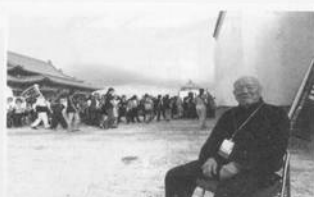
印刷/和平彩色製版公司