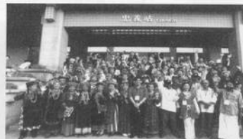
美術編輯/盧鄂杰和、范慧君