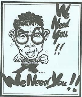
We Need You! 漫畫 / 盧郭杰和

個人都很被寵愛；很多事是相對的，現在是制度化了，卻往往僵化了，可是藝術卻是最怕這樣！現在想起這些來很快樂，懷念也特別多.....儘管我以前總是太自我、太直接而得罪了許多老師。