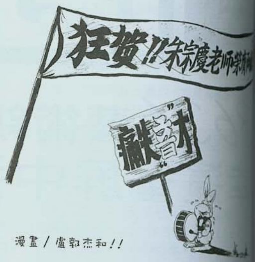
漫畫 / 盧郭杰和!!

三月間，馬來西亞一份報紙報導台灣有食人餐廳，還圖文並茂的登載一名男子正津津有味地噬食一隻嬰兒的小手臂。結果，台灣全島嘩然，引起全國上下一陣撻伐。其實，這只是中國大陸前衛藝術家朱昱所創作，並掛在網際網路上的視像作品，竟被如此一家不負責任的大馬報紙拿來惡意渲染。這種烏龍事件多虧某位勤於問政的立委提出質詢；外交部緊急應對，以對方道歉收場。不過，它卻是一個相當嚴肅且極具意義的美育（美學教育）問題。