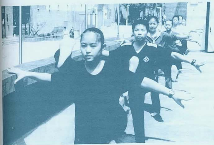
聽藝術學院何其難矣!!!

另外，本校十一所研究所招生，也將在四月底展開筆試及專業科目術科考試作業。今年計有五百五十二名報考，預計錄取一百七十三名，錄取率 31%。