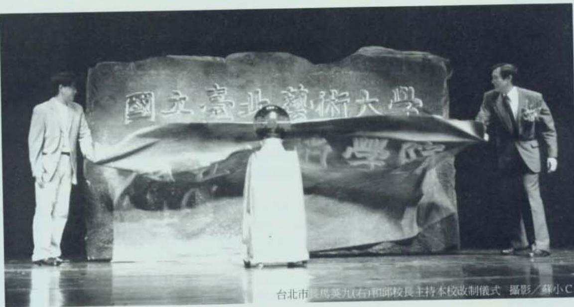
台北市長馬英九(右)和邱校長主持本校改制儀式