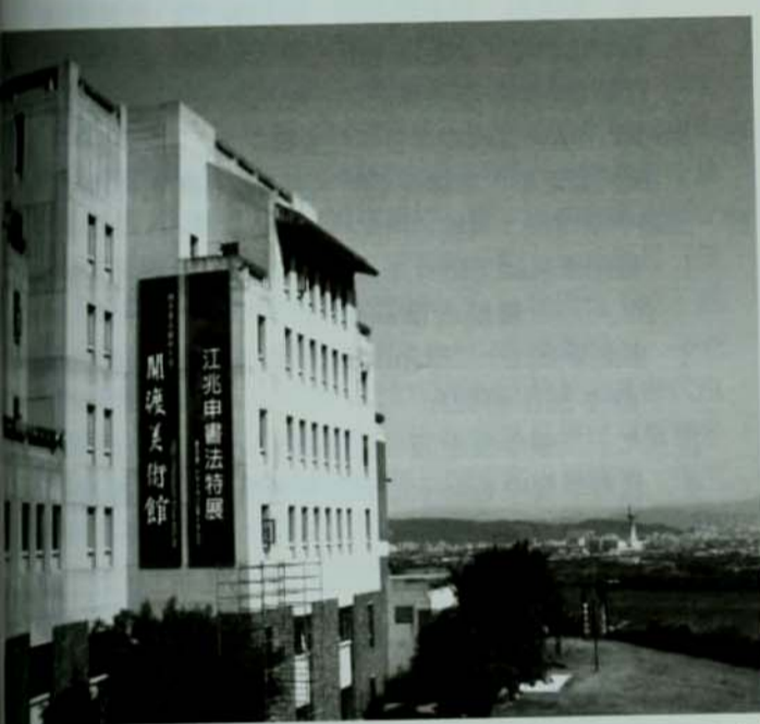
美術館整修後推出第一檔大展，展出江兆申書法作品，醒目的布招掛在牆上吸引了許多人注意。