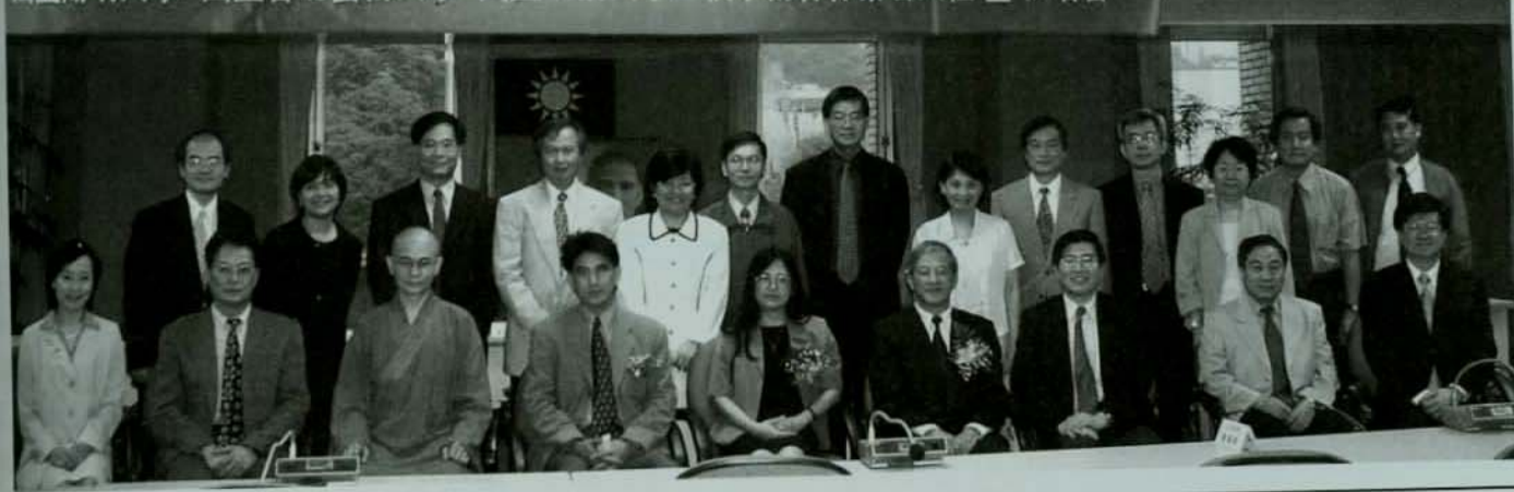
國立陽明大學·國立台北藝術大學·國立政治大學三校學術合作簽署典禮暨記者會