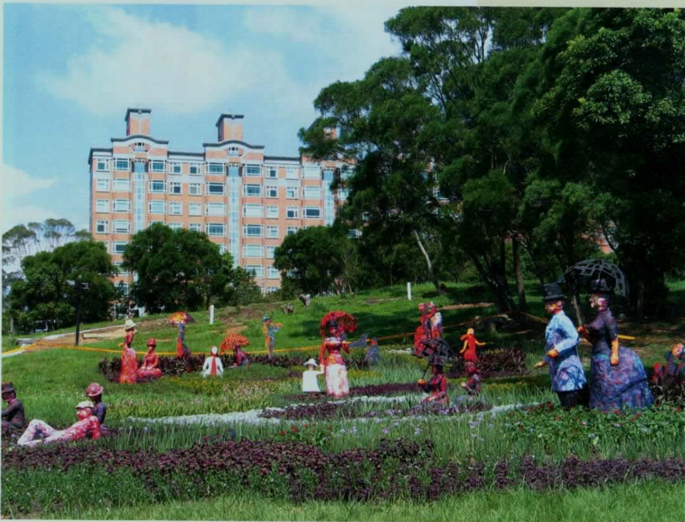
▼ 結合花草與藝術創作的「假日午後」。