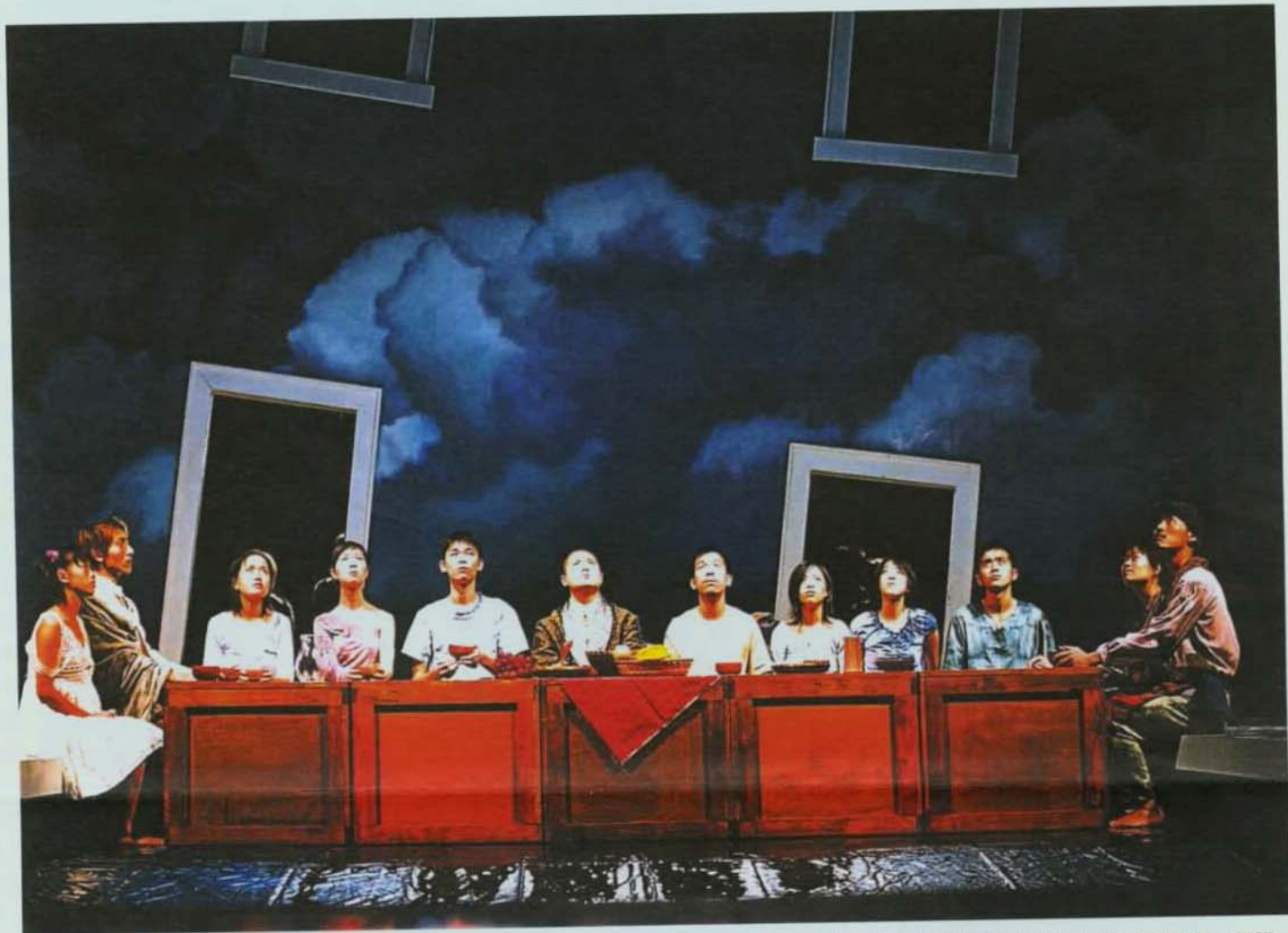
▲ 關渡戲劇節熱烈展開，圖為台北藝大戲劇學院演出的「航向愛情海」劇照。