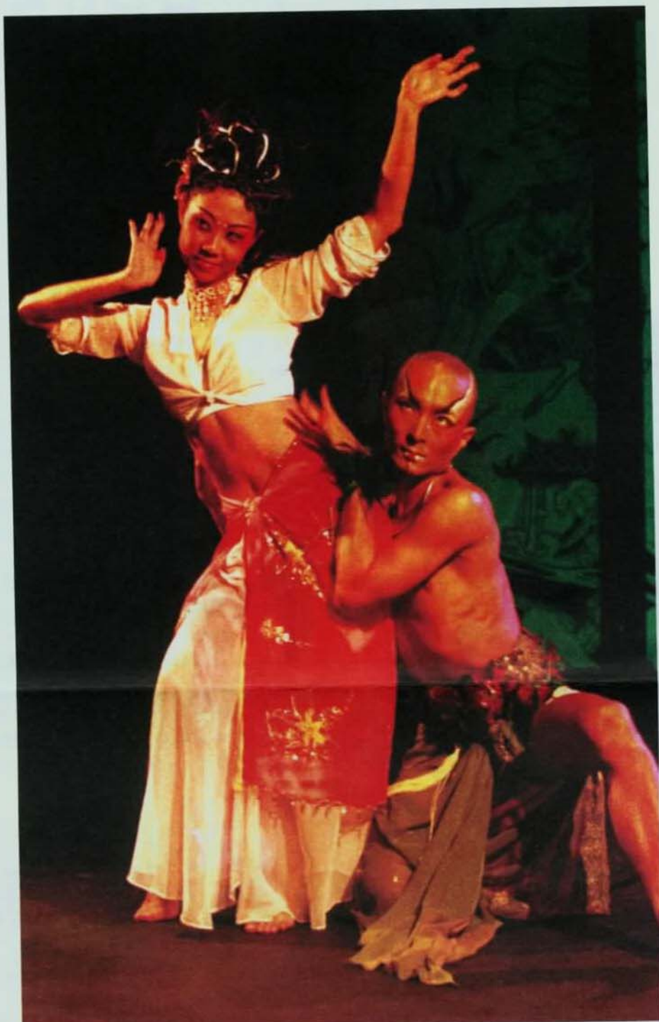
▲ 馬來西亞的川草舞蹈劇場的演出。

項活動。二十人及來自印度、日本、印尼、美國、伊拉克、亞賽拜然、土耳其、寮國、南韓、英國、美國、俄羅斯、法國、加拿大等國共二十。十月十日及十月二十六日，針對及子題舉行研討會及專題演講。研討會的三十篇論文，分別從文化、聚落發展、音樂風格、織染特、舞蹈動作、戲劇等不同面向探索