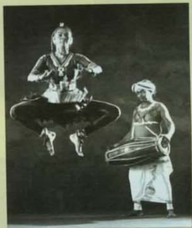
▲ 2003亞太藝術論壇特別報導 詳見三、四、五版