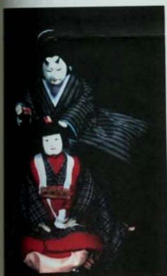
日本淡路人形劇團的演出。

亞太地區各國家之間的文化接觸好幾世紀之前就開始了，並且也已經對全球造成了深遠的影響。進入全球化與科技化的今天，文化接觸更形重要，也會更加頻繁。為了對亞太地區的不論是過去還是現在的文化接觸有更進一步了解與認識。