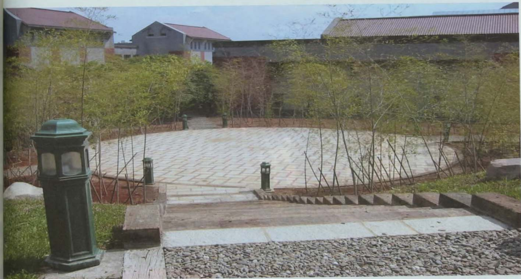
▲ 學生活動中心戶外綠竹在風中搖曳。

大道兩旁舞蹈、戲劇學院的平台，如今已煥然一新，平台旁加上了可乘涼的鐵椅和成排的孟宗竹，這四百餘株的修長綠竹讓景觀細緻、隨風搖曳起來，其間還穿插著幾株楓樹，同時這裡將是露天咖啡座設置的最佳休憩點，原本無法使用的坡邊地，如今轉化為一個眺望關渡美景的新聚點。