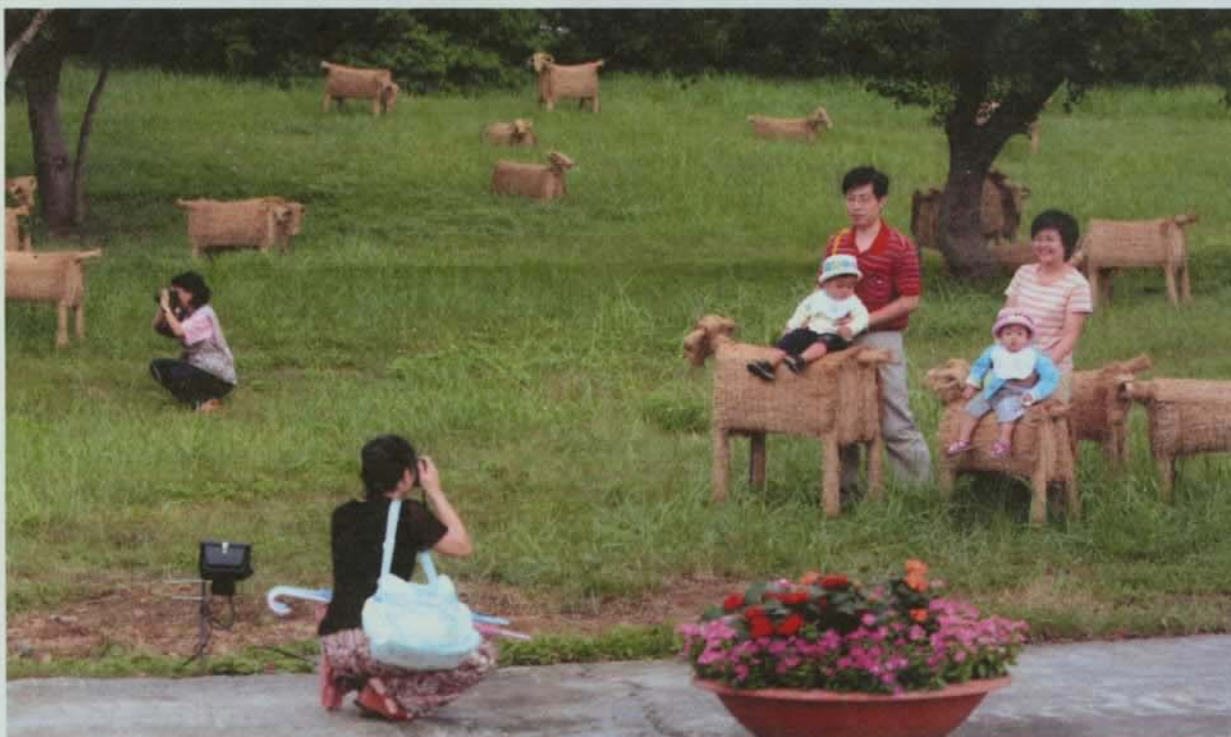
▲ 群羊在鶯鶯草原是花卉藝術節熱門的留影景點。

秀拉的「點描」作品不少，最著名的即是「大碗島夏日的星期天午後」，是新印象派的一個範本。秀拉為了製作這一幅巨作，花了兩年的時間，四百多幅的素描稿與顏色效果圖，為的是讓顏色更準確。他將點描派的特色發揮的淋漓盡致，圖中各式各樣的人，每一個都是畫家經過仔細的構圖而形成。「在一個天色晴朗的星期天下午，聚集在這裡尋歡作樂」，畫中想表現那種安逸的詩意，令人感動。圖中的景觀人物好像沒有關係地聚在一起，使畫面充滿著一種寧靜的秩序美。