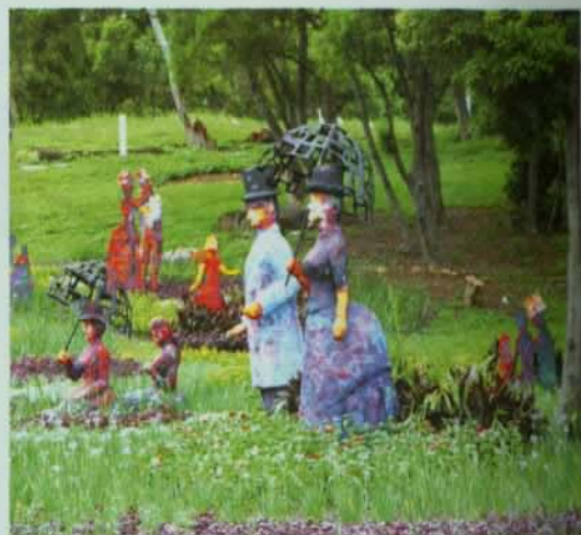
▲ 根據法國秀拉名作所製作的「假日午後」裝置藝術。

除製作人物之外，他還特別設計小畫框讓觀眾透過畫框的侷限去欣賞到另一種形式的畫面。這使整件作品從最初二度的空間被轉入三度的雕塑風景，再用畫框欣賞的形式回歸二度的呈現而不失原畫的閒情意致，是一種相當有趣、能使觀眾