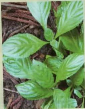
▲ 關渡校園新境界 詳見七版

發行/國立台北藝術大學 發行人/邱坤良 社址/台北市北投區學園路一號 編務執行/藝術行政與管理研究所