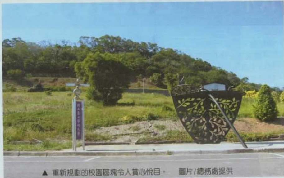
▲ 重新規劃的校園區塊令人賞心悅目。