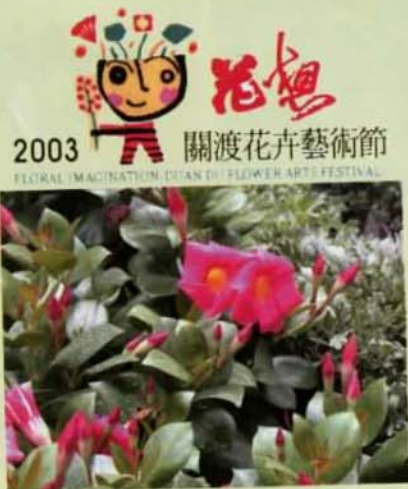
▲ 花卉藝術節專刊詳見：(三、四、五、六版)