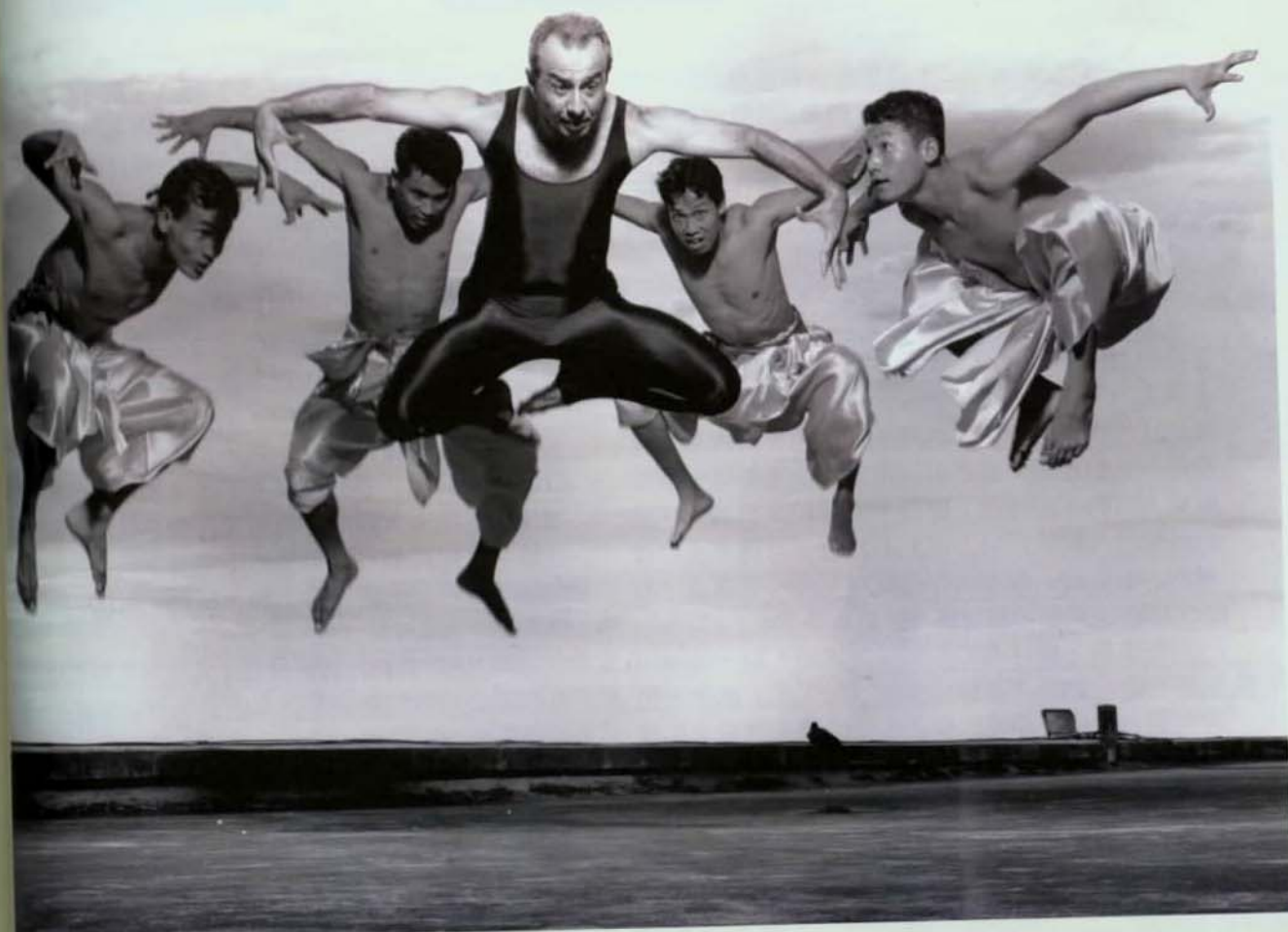
▲2003亞太傳統藝術論壇印度的ASTAD DEBOO 將有精采演出。