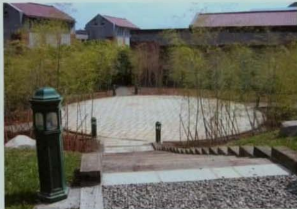
▲活動中心的圓形平台有竹影搖曳。