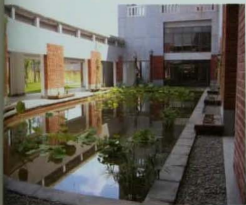
▲校園心臟區域的活動中心中庭新添了荷花池。