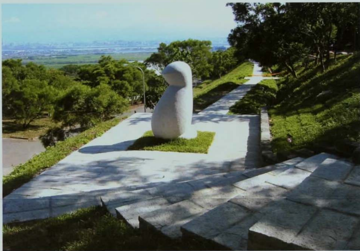
▲校園新景之一的雕塑公園。

活動中心日後將是學生最重要的活動之處，透新心的經營及善用現有的環境，藝大希望呈現一種風情，宛如藝術的百家爭鳴，漫步在竹林聽聽耳的是不斷的琴聲與聲樂練唱，令人有時錯置之感，明明是竹林七賢的哲學清談場景，