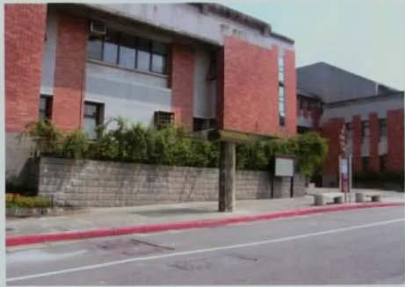
▲師生設計的新穎候車亭宛如雕塑品。