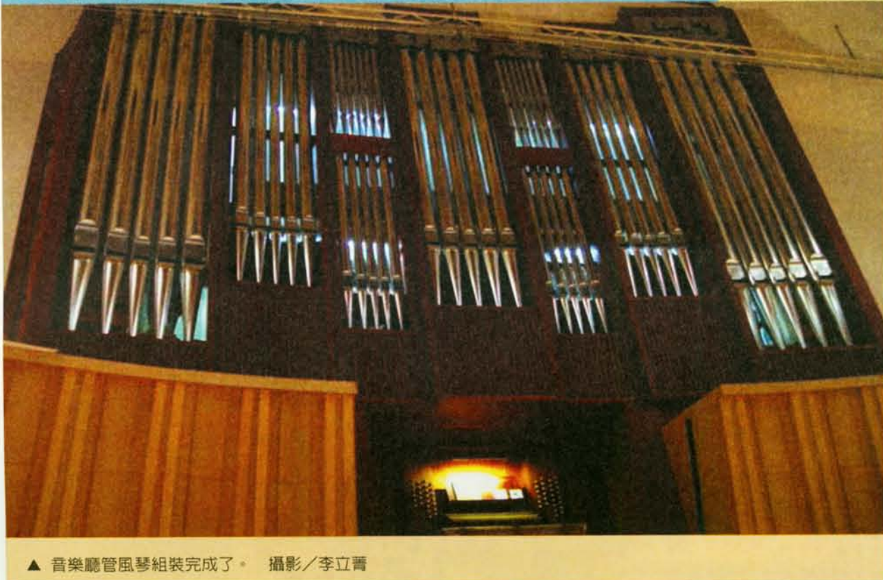
▲ 音樂廳管風琴組裝完成了。

發行／國立臺北藝術大學 發行人／邱坤良 社址／台北市北投區學園路一號 編務執行／教務處出版組 2004年10月30日出刊