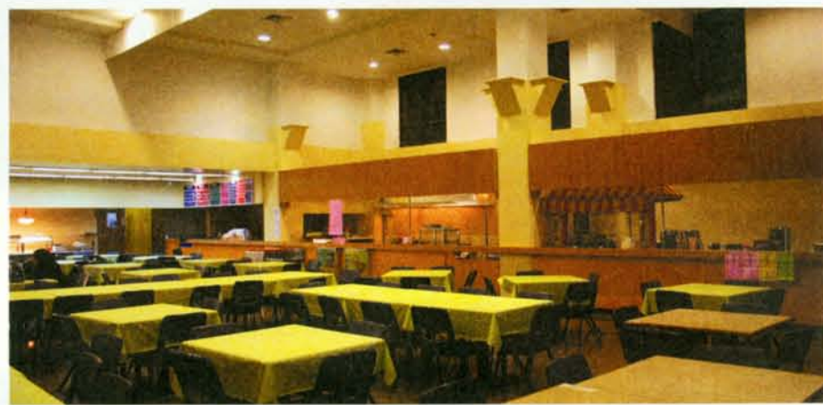
▲ 學生餐廳一角。