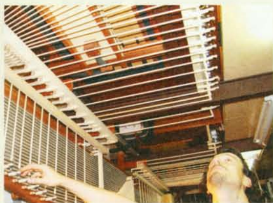
▲ 管風琴內部複雜的牽引桿。