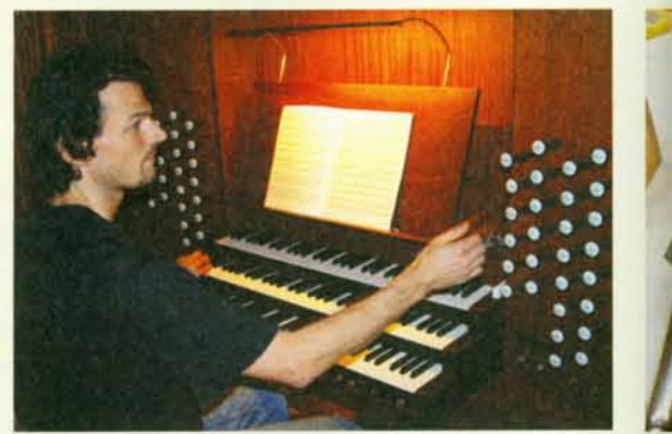
▲ 德國技師解說管風琴音栓用法。