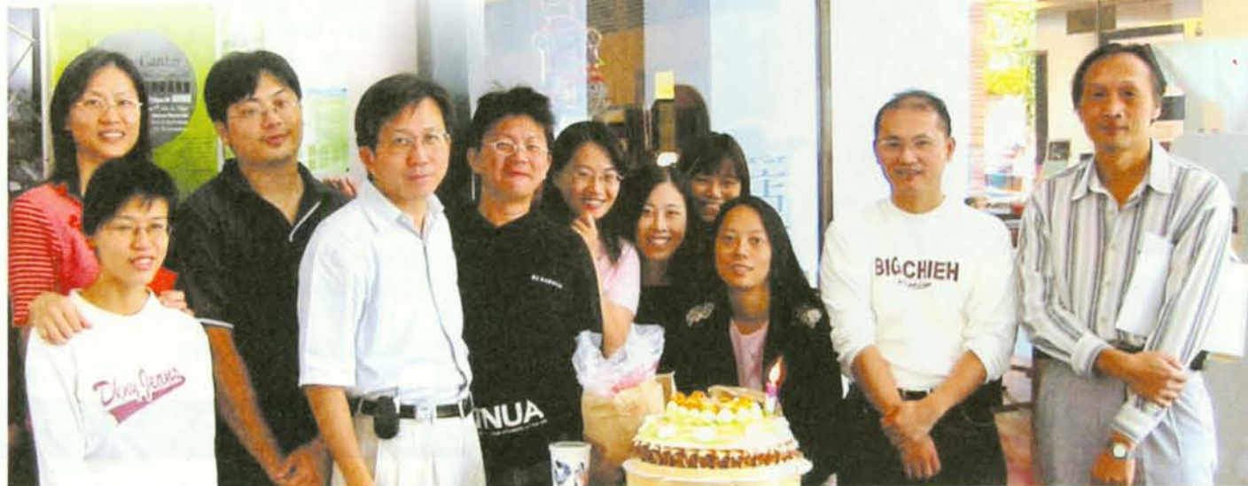
▲ 藝大書店周歲了；研發中心為它唱生日快樂歌。

這當中有著許多助力支持的，從工程中結構與內裝的發包、採購，以至於工程進度的掌控、及財會、請款流