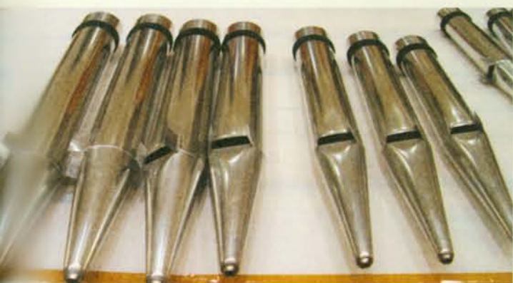
▲ 管風琴裝有許多風管。

巴哈以出神入化的鍵盤與高超無比技術聞名於世，大家可以想像，當音樂家手腳並用，又是鍵盤、踏板、音栓、飛毛腿及千手幻影在台前飛舞忙碌，那表演盛況必定引人讚嘆。