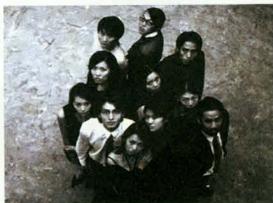
▲「愈來愈難集中精神」的演員群

此次演出，將把時空放在約五十年後的近未來，社會背景著重在一種正在當下隱隱醞釀的現象，藉以暗喻，或者說大膽的預言未來制式化的、被科技淹沒的、人被壓抑的病態社會。上述的這種現象廣義來說，甚至包括了不知不覺中正在制約人們選擇的一切廠牌，亦即一種高度集中化的資本主義與國家機器的完美運作與結合。原劇中代表極權政府的科學四人組與實驗，在被預言的未來社會結構中，則為「機械生活」下了一個標準的