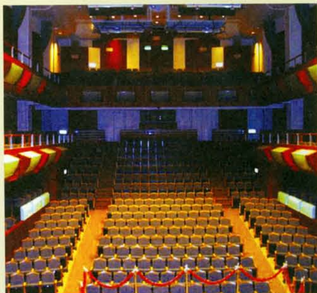
▲ 音樂廳的椅子將永久留下捐款人的名字。