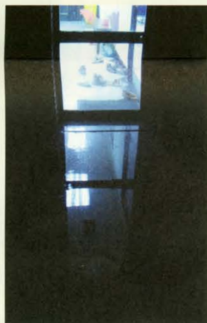
▲ 形相之二