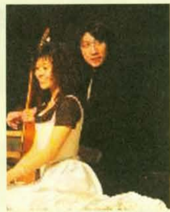
▲ 櫻桃園熱演 詳見三版

發行／國立台北藝術大學 發行人／邱坤良 社址／台北市北投區學園路一號 編務執行／藝術行政與管理研究所