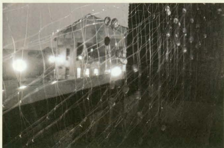
▲ 和校園在雨中相遇