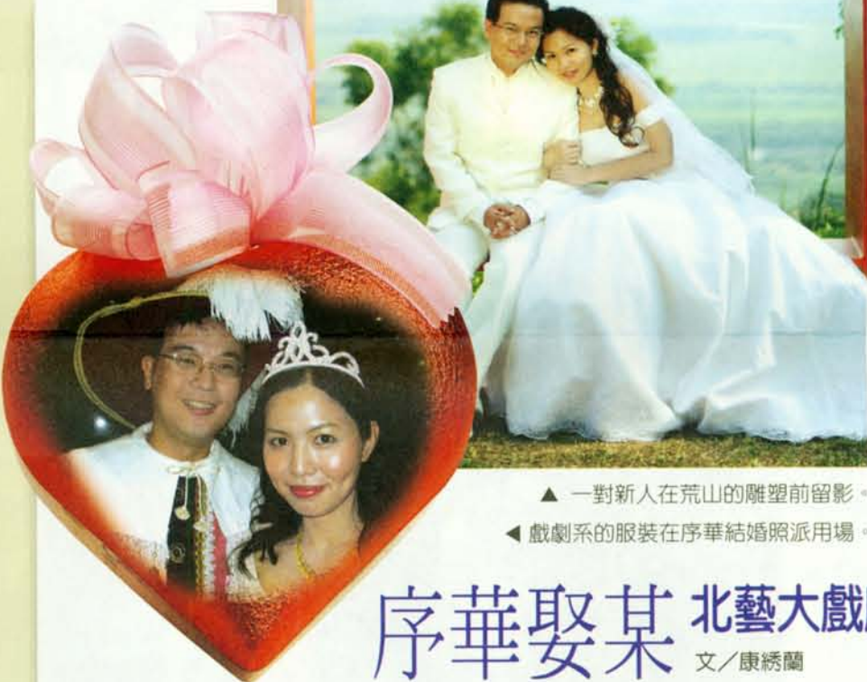
▲ 一對新人在荒山的雕塑前留影。