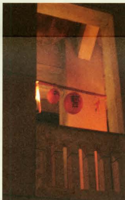
▲ 形相之一