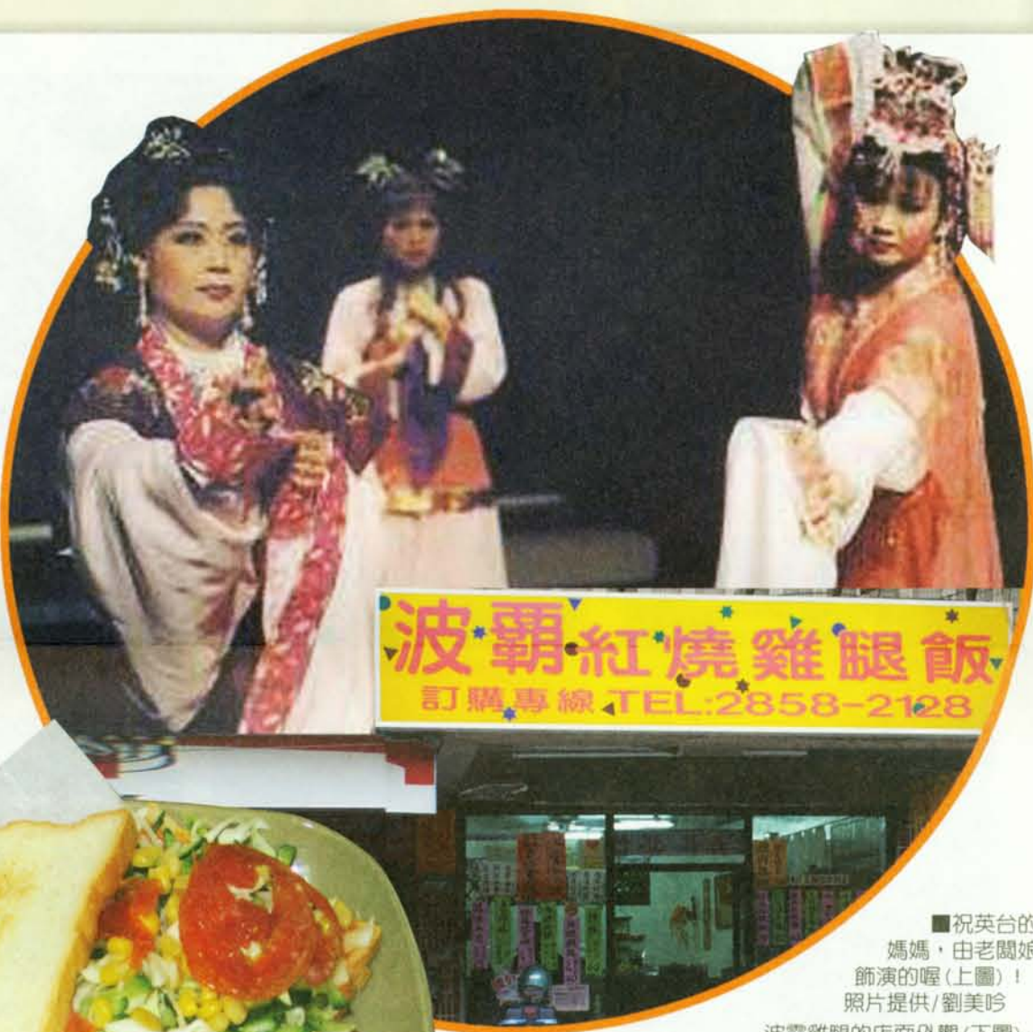
■祝英台的媽媽，由老闆娘飾演的喔（上圖）！

不僅如此，便當也隨附湯和甜點（綠豆湯）。菜色變化多樣新鮮又營養，價格合理，是很多學生喜歡用餐的好地方，除了填飽肚子外，店裡放的音樂很優雅，也多了一份享受。