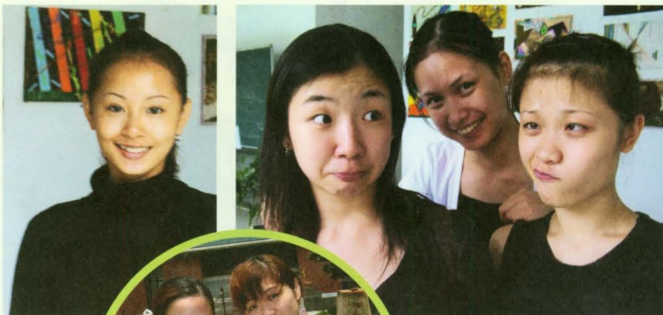
▲ 舞一貫六 劉奕伶