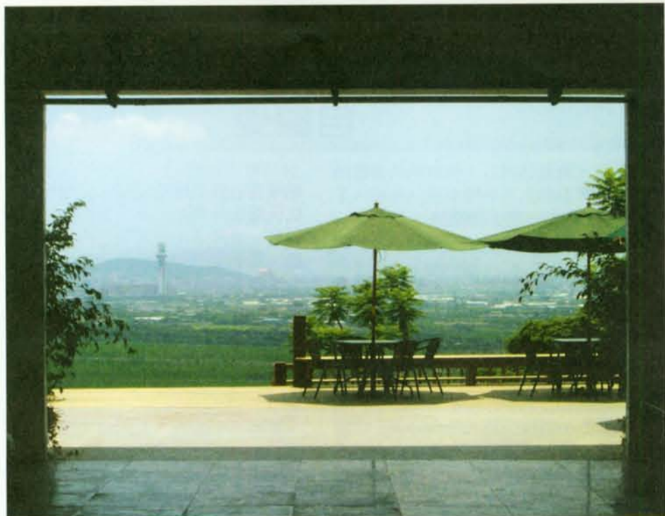
▲ 走向觀景台，像走向夢境。