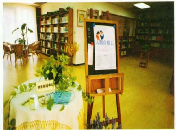
▲ 學輔中心佈置得清爽宜人。 夜間延長時間：周三到19:30，周四到18:00。輔導老師諮商時段，則需事先預約。

學輔中心的服務時間是週一至週五8:30-17:00，直撥電話2893-8723，電子信箱： consultant@student.tnua.edu.tw ，學輔中心位於學生活動中心二樓(與藝大書店同樓面、保健中