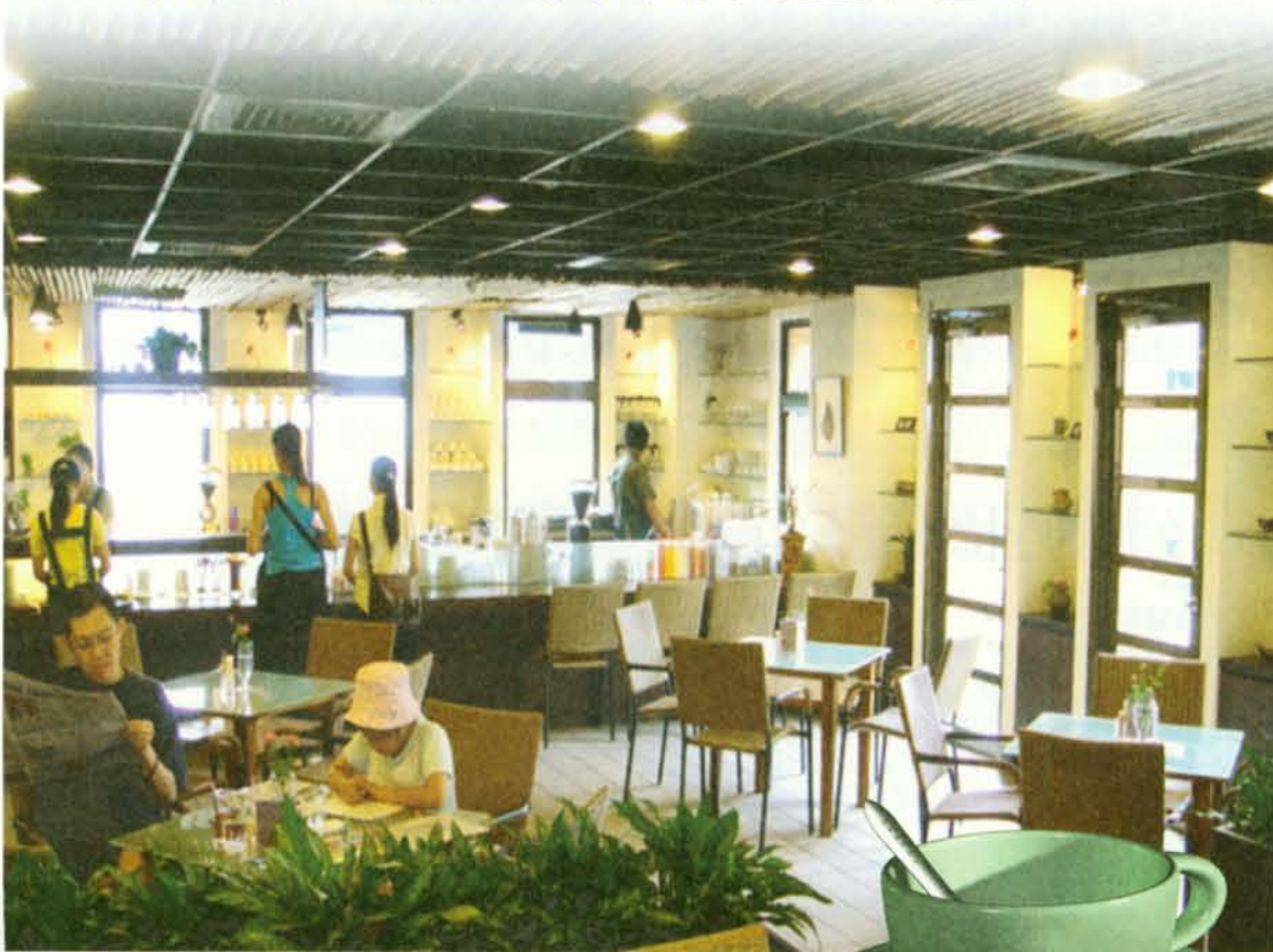
▲ 藝大咖啡廳的午後。