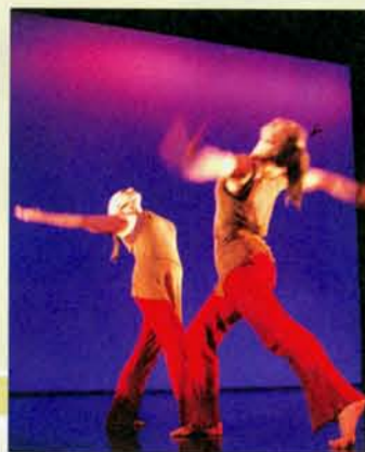
▲ 澳洲舞者演出「Land Skin」