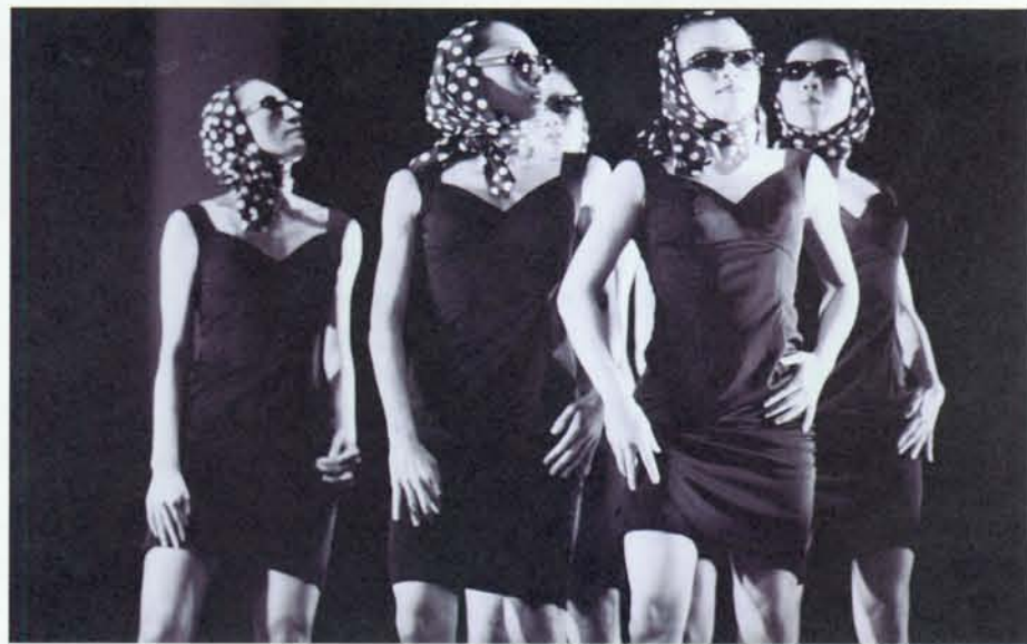
▲ 三十舞蹈劇場演出「宓若思」