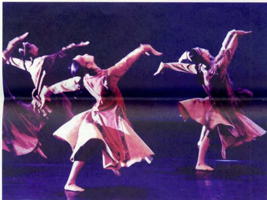
▲ 北藝大舞蹈系演出孔和平編舞的「喀爾馬克琴曲」。