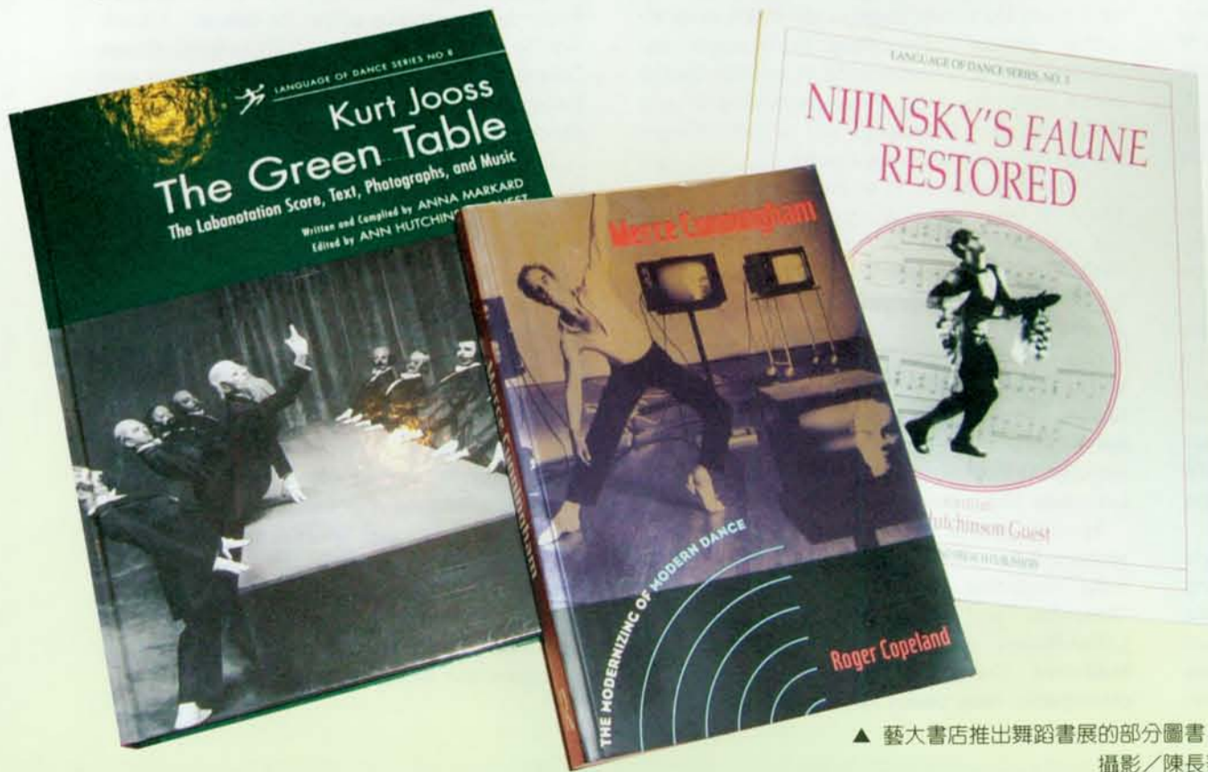
▲ 藝大書店推出舞蹈書展的部分圖書。