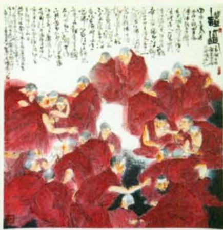
▲ 林章湖彩墨作品「辯經」。