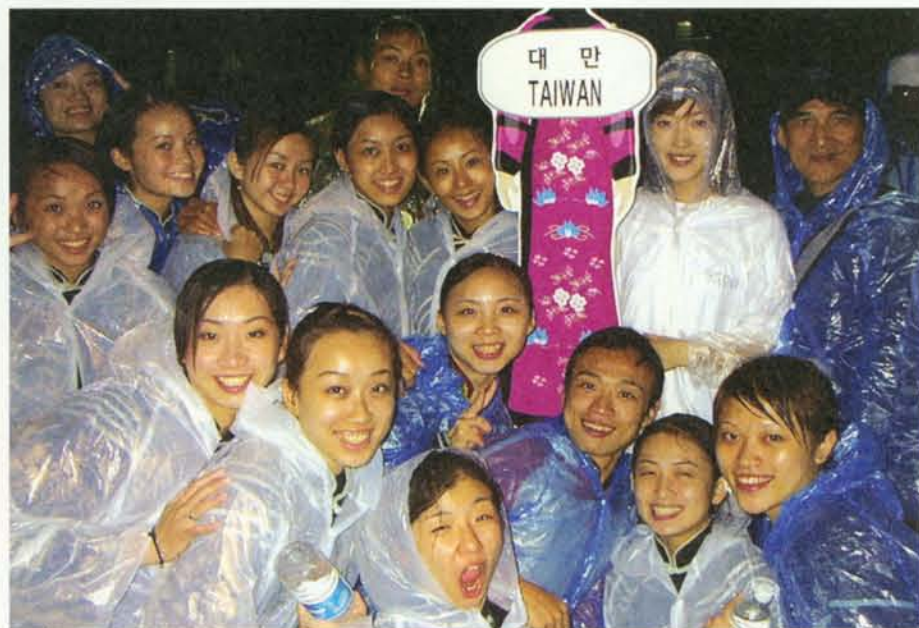
▲ WCO開幕之夜，北藝大師生在邱校長（右後）率領下冒雨上場。

「每個文化都是非常獨特的，所以每個人都是winner!」這是張院長帶領學生上台時發表的感想。