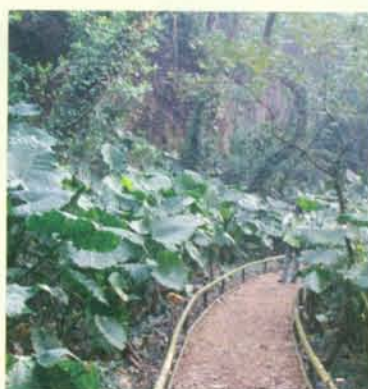
▲ 校園生態姑婆芋區 詳見四五版