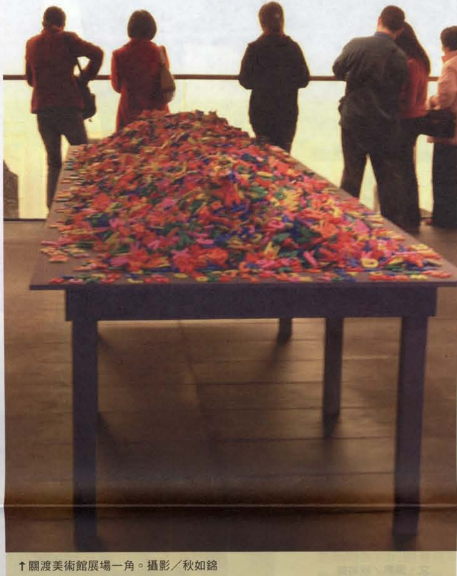
↑關渡美術館展場一角。

關渡美術館的創建，可謂臺北藝大美術學院教師積極奔走的結果。地上四層、地下一層的美術館建築，入口的廣場與戶外空間為雕塑廣場。館內共有九個展覽廳，其中一樓為三間合乎國際標準規格、恆溫恆濕的大型展覽廳、客座策展室及休憩區；設備完善的典藏空間及攝影室位於地下室。整座建築物面積七千多平方公尺，內部空間佈局寬廣，採光充足，較諸台北市立美術館、國立台灣美術館、高雄市立美術館並不遜色。不過，前述公立美術館分屬文建會與台北市、高雄市政府，不論人事編制、業務經費與典藏品皆有一定規模。關渡美術館則屬大學附屬單位，教育部所能核准的員額、經費極為有限，兩相比較，有天壤之別。