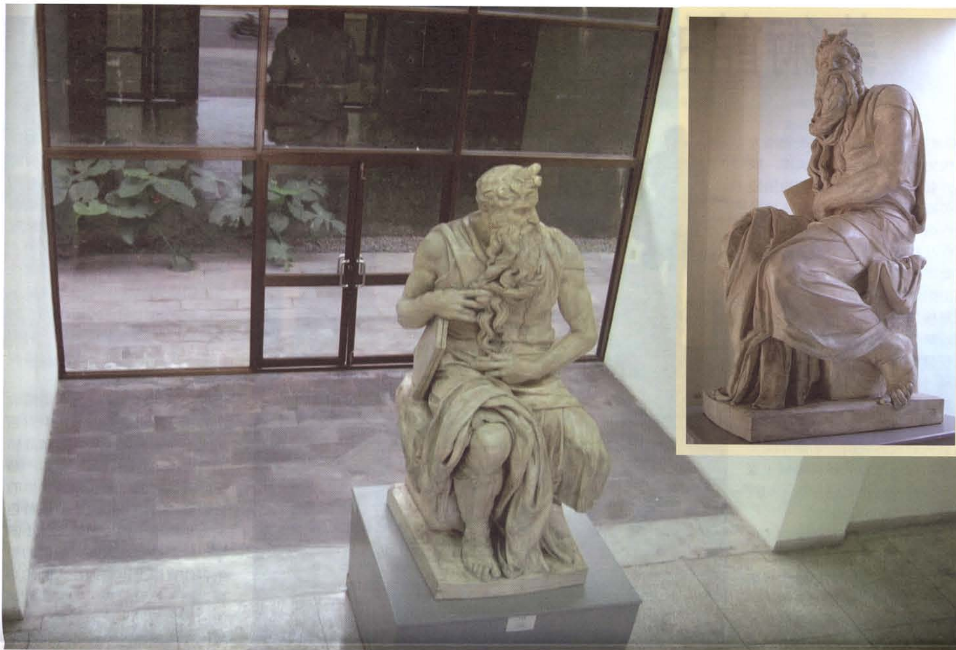
↑米開蘭基羅「摩西像」的石膏複製品坐在寬敞的行政大樓大廳