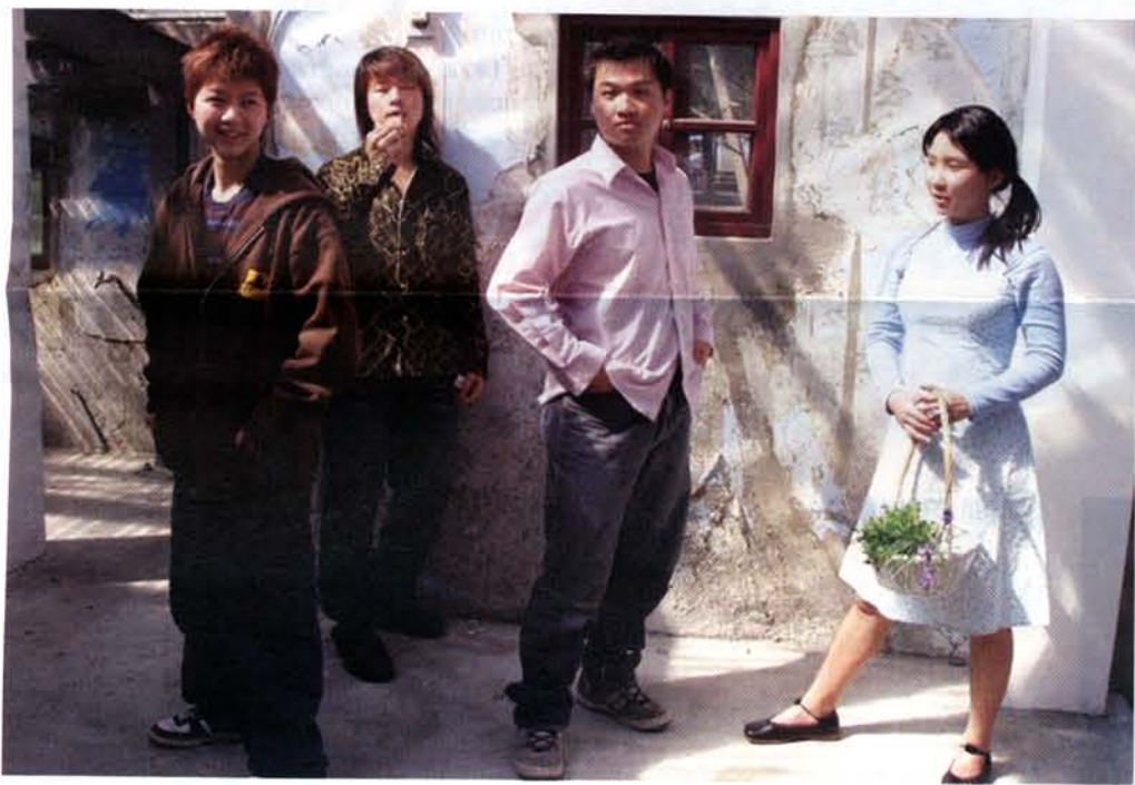
↑「藍，日子The blue, blue days」的劇照