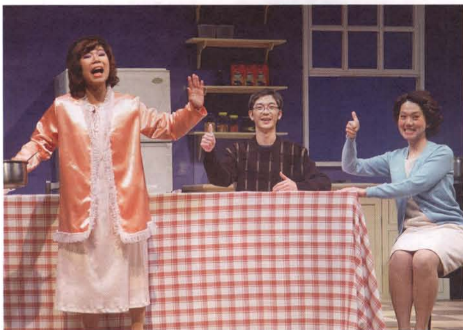
↑ 戲劇學院2005春季公演「心之所欲」劇中一幕。