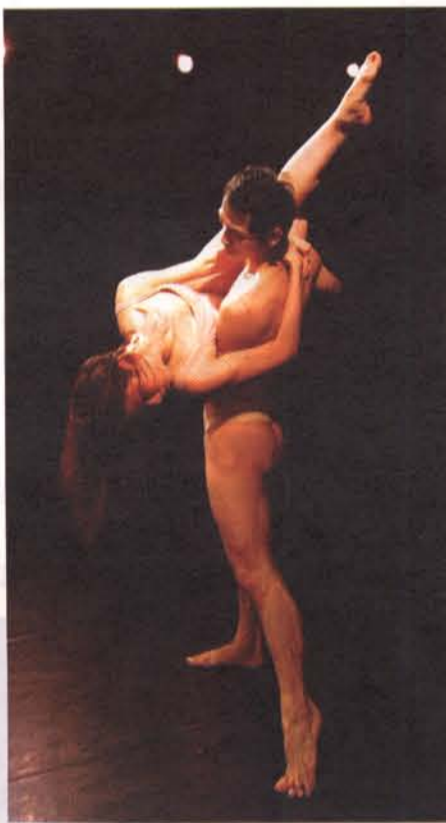
●北藝大舞蹈系五年制最後一屆畢業製作—(晃·點 SPOT18-Last To be Last)已於四月初於北藝大展演中心舞蹈廳及中南部其他城市巡演。該演出準備期長達一年半，由第十八屆畢業班共二十一位畢業生獨立創作、募款及演出。舞作內容多元，展現新一代舞蹈工作者嶄新的視覺觸角。

該舞團成立至今，演出及舞蹈教學示範講座超過百場，在「推廣舞蹈藝術，培養舞蹈觀眾」的立團宗旨下，焦點舞團此次巡迴各地，演出14支舞作，包括雲門舞集名作「水月」的片段，以及20世紀現代舞的代表作之一，出自美國編舞家崔莎·布朗之手的「組合·再組合/再組合」(Set and Reset/Reset)。