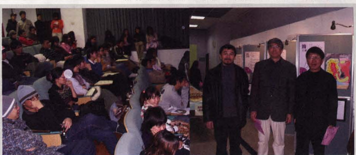
▲ 影展現場座無虛席