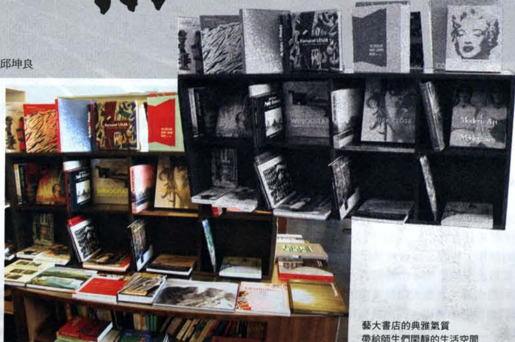
藝大書店的典雅氣質 帶給師生們開靜的生活空間

此外，空間與動線亦是塑造書店品牌與形象，吸引顧客、讀者的重要方法。藝大書店內部空間設計出自幾位藝術家之手，雙層百坪的格局設計別緻，空間挑高、開闊，本身就是裝置藝術，也是一個影像與視聽中心。其周圍環境緊鄰藝術大道的戲劇廳、舞蹈廳，直通音樂廳與水舞台，銜接美術館，成為校園展演活動最溫馨可親的支援空間。觀眾在觀賞表演節目或美術館展覽前後，可在藝大書店休憩、翻閱