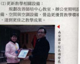
▲ 南安國史中校長致歡迎詞

(1) 藝術與人文教學網路平台 師培中心專業社群互動學習平台首頁建置，已請廠商初步建構完成，現已進入實質操作、測試階段。 更新教學相隨設備： 規劃改師培中心教室、辦公室原顯明備、空間與設備設置，營造更優質教學環境，達到更佳之教學成果。