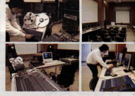
▲ 數位生活網頁設計：課程教學實景