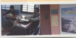
3月28日完成第一次教師研習會議