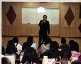
▲ 南安國史中校長致歡迎詞