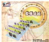
▲「通才融入專才通識教學卓越計畫」理念圖

延續94年度執行成果，本年度根據這四個面向作為未來執行的核心，並納入考量校內自評量與教育評量學思，調整配合作為95年度執行與發展方向，持續發展支持通才融入專才的藝術專業教育。