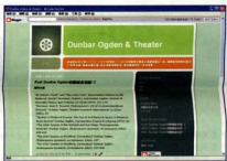
▲ Dunbar Ogden & Theatre 部落格 ( http://tnual.blogspot.com )

● 國內、外國書資源結盟 資源面的廣幅伸展，為追求教學卓越的重要後援基礎之一。本校與韓國藝術大學等校締結姊妹校與交換學生，有效引進國外大學特有出版品，同時將本校出版品推向國際，互惠雙贏。本項目預定陸續與國外大學進行圖書資源合作，並加入 Theater Library Assn.、Music Library Assn. 等國際性藝術專業圖書資源組織。