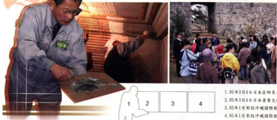
1 2 3 4