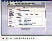
▲剛上線之本校電子學位論文系統

● 本校學位論文數位典藏 碩、博士論文是畢業研究生的智慧產出，紮實的學習紀錄值得收藏。今年度計畫第一季重點為建置本校學位論文文獻系統，在校長支持下，本校加入中文學位論文服務 (Chinese Electronic Theses and Dissertation Service; CETD)，與國內台大、政大、交大、清大、淡江等十餘所校院，整合兩南四地博碩士論文於單一平台的學術性服務。5月初正式上線，並進行研究生推廣講習會。對於研究生而言，體化上傳論文作業，簡便授權機制外，幫助學術流通，大幅提高本校學位論文在國內和國際上的能见度。