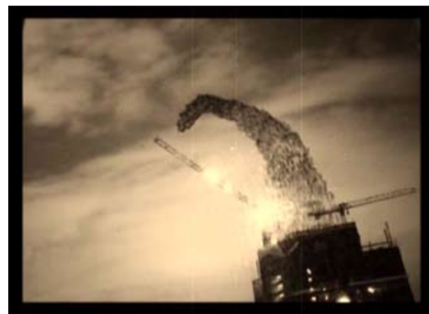
■ 黃國才《Shadow Building》