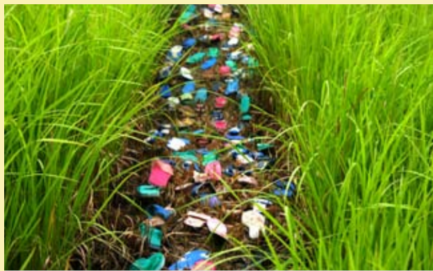
■ 拉黑子《看見了是走不到的盡頭》

拉黑子十幾年前歷經一場足以帶走他生命的颱風後，便開始試圖與颱風、環境對話，省思人與自然的關係，直到2007年，開始著手策劃《Fali-yos颱風》