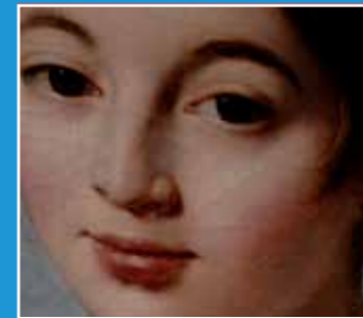
10/8-10/24 關渡電影節 2010 the second Kuandu Film Festival

兩廳院售票系統 www.artsticket.com.tw (02)3393-9888 藝大書店 台北市北投區學園路一號 (02)2893-8878