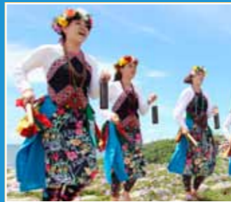
10/30-10/31 原舞者 《芒果樹下的回憶》 Memories of Mango Trees