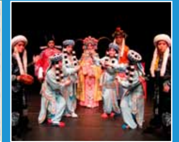
10/15 北藝大傳統音樂學系 南管戲 《昭君和番》 Nanguan Opera, "The Female Prince"