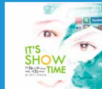
10/29-10/31 表演共和國 《It's Show Time!!》