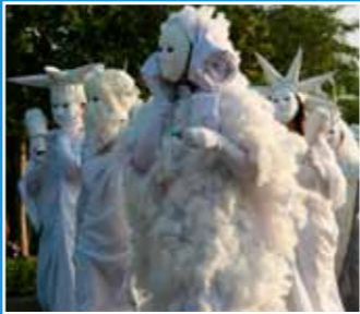
10/9 扮裝遊行關渡宮/扮裝藝陣比賽/ 原民祈福 Costume Parade and Creative Arts Exhibition and Aboriginal Ritual