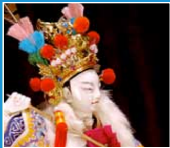
10/16 亦宛然掌中劇團 北管布袋戲 《鄭和下西洋》 Beiguan Hand Puppet Theater— "Voyages of Zheng He"