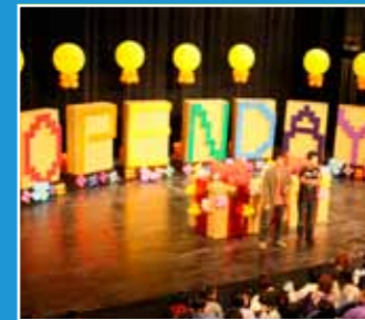
10/20 OPEN DAY 遊藝北藝大暨教學卓越成果展示