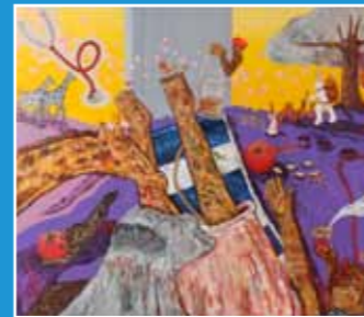
10/8-12/31 關渡雙年展 《記憶的總和》 Memories and Beyond