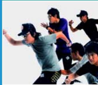
10/9 拷秋勤樂團 《樂團開唱·拷秋勤在關渡》 Band Rock Out · Kou Chou Ching in Kuandu