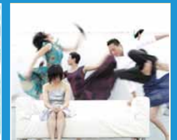
10/29-10/31 台灣古名伸與香港動藝舞蹈團 《最遙遠的距離》 Unreachable Listance