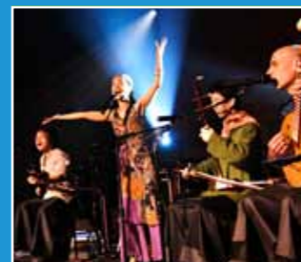
10/24 聲動樂團 《世界風—聲動世界音樂系列》 A Moving Sound "World Winds"