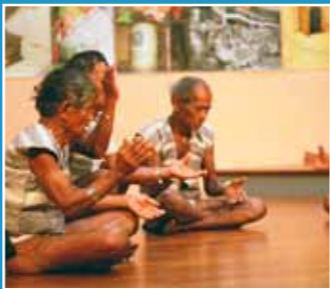
10/30 蘭嶼達悟族《Mikarayag拍手歌會》 21:00開始通宵達旦 Orchid Island Tao's Mikarayag Clap- ping Performance