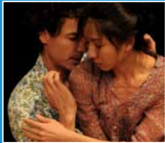
10/8-10 Egli / Tsai Production 《出口之間》 Exit as Issue