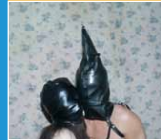
10/14-10/17 莎士比亞的妹妹們的劇團 《海納穆勒·四重奏》 Quartett von Heiner Muller