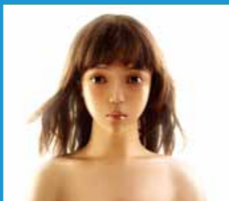
10/22-10/24 國立臺北藝術大學與廣藝基金會 《萬有引力的下午》 L'Après-midi de la Gravitè