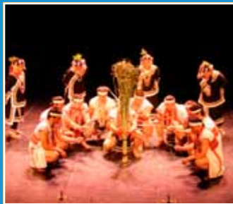
10/16 屏東縣泰武鄉和平部落 南投縣信義 鄉布農文化協會 《世界文化遺產－聲音的奇蹟》 World Cultural Heritage - The Sound of a Miracle