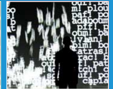
10/21-10/23 Compagnie Adrien M 《運動學》 CINÉMATIQUE