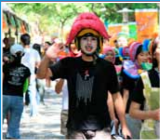
10/16-10/17 創藝市集 Art+Fair=Wonderland