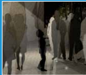
10/16-10/17 水母漂集團 《Hold Down》 HOLD DOWN An Interactive Perfor- mance that Spans Boundaries