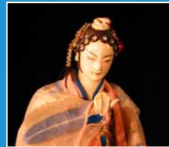
10/17 亦宛然掌中劇團 北管布袋戲 《白蛇傳》 Beiguan Hand Puppet Theater— "Legend of White Snake"