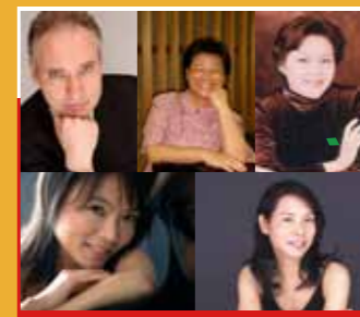
10/23 北藝大音樂系教授 《352鋼琴密碼Piano Monster Concert》