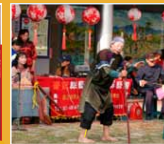
10/23 美濃客家八音團與田屋八音團－ 《台灣南北客家八音大拼宮(堵班)》 Taiwan South and North Hakka pa-yin(Beiguan) battle