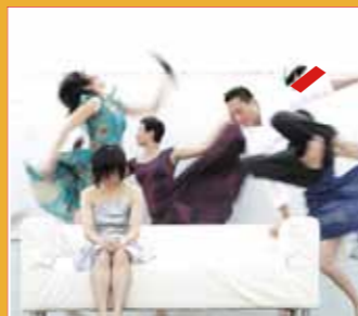
10/29-10/31 台灣古名伸與香港動藝舞蹈團 《最遙遠的距離 Unreachable Distance》