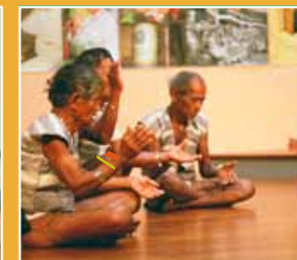
10/30 蘭嶼達悟族 《Mikarayag拍手歌會》 21:00開始通宵達旦(Orchid Island Tao's Mikarayag Clapping Performance)