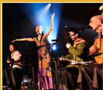
10/24 聲動樂團 《世界風－聲動世界音樂系列》 (A Moving Sound "World Winds")