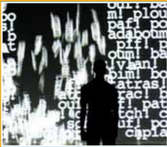
10/21-10/23 Compagnie Adrien M 《運動學CIN MATIQUE》