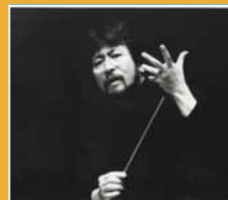
10/29 吉拉·普雷(Gérard Poulet)與北藝大管絃樂團 《小提琴奏斗普雷與北藝大管絃樂團 Maestro Poulet & TNUA Orchestra》