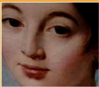
10/8-10/24 關渡電影節 (2010 the second Kuandu Film Festival)