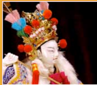
10/16 亦宛然掌中劇團 北管布袋戲 《鄭和下西洋》 (Beiguan Hand Puppet Theater - "Voyages of Zheng He")