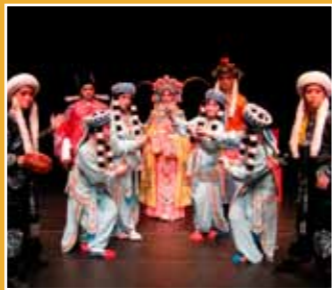
10/15 北藝大傳統音樂學系 南管戲 《昭君和番》 (Nanguan Opera, "The Female Prince")