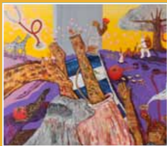
10/8-12/31 關渡雙年展 《記憶的總和 Memories and Beyond》