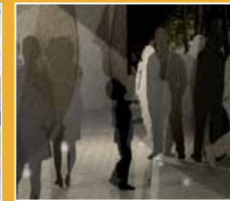
10/16-10/17 水母漂集團 《Hold Down》 (HOLD DOWN An Interactive Performance that Spans Boundaries)