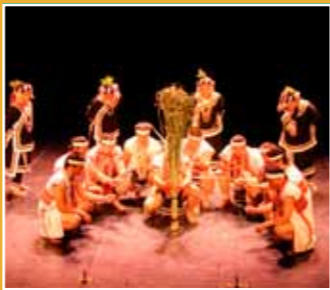
10/16 屏東縣泰武鄉和平部落 南投縣信義鄉布農文化協會 《世界文化遺產－聲音的奇蹟》 (World Cultural Heritage - The Sound of a Miracle)