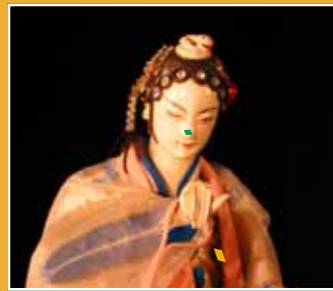
10/17 亦宛然掌中劇團 北管布袋戲 《白蛇傳》 (Beiguan Hand Puppet Theater - "Legend of White Snake")