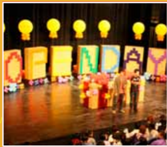
10/20 OPEN DAY