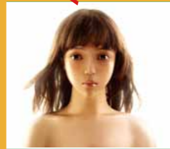
10/22-10/24 國立臺北藝術大學與廣藝基金會 《萬有引力的下午 L'Après-Midi de la Gravit》