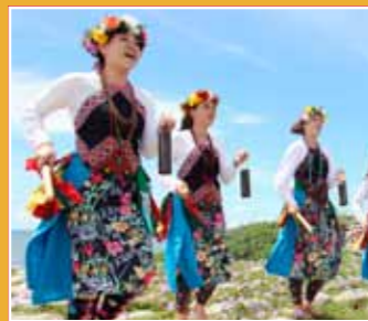
10/30-10/31 原舞者 《芒果樹下的回憶 Memories of Mango Trees》