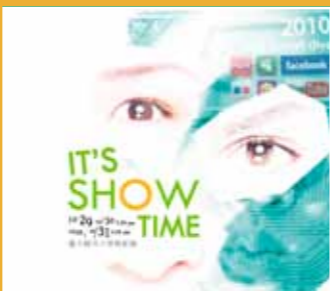
10/29-10/31 表演共和國 《It's Show Time!!》