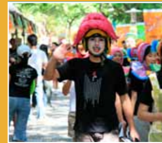
10/16-10/17 創藝市集 (Art+Fair=Wonderland)