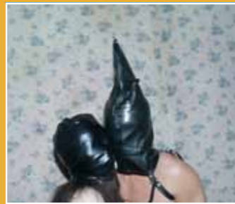
10/14-10/17 莎士比亞的妹妹們的劇團 《海納穆勒·四重奏 Quartett von Heiner Muller》