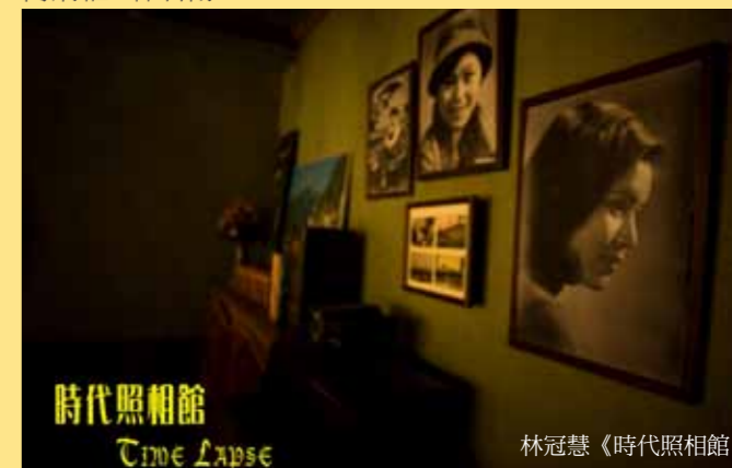
時代照相館 Time Lapse